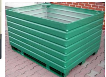
Pallet con max 3 telai (se necessario con rivestimento interno)