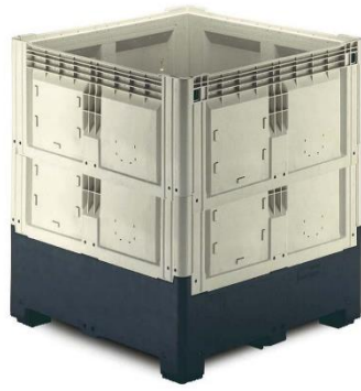
Paloxes en plastique