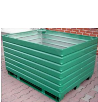
Caisses en métal

D'un volume max. de 3 m 3 et d'une hauteur max. d'1,5 m, les conteneurs doivent être remplis sans que les DEEE puissent en tomber: il ne faut donc pas dépasser une hauteur de remplissage et prévoir des côtés et un fond suffisamment fermés. Si nécessaire, les conteneurs doivent être habillés par exemple d'un film intérieur indéchirable pour les caisses grillagées ou d'un revêtement de fond pour les palettes en bois.