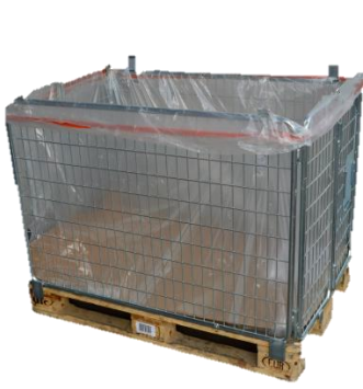
Caisses grillagées (avec habillage si nécessaire)