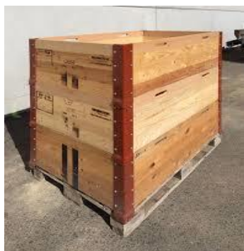
Palettes avec 3 cadres max. (avec habillage si nécessaire)